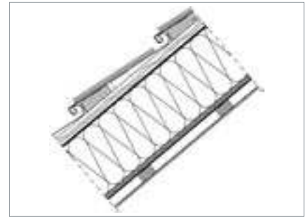
Konstruktionsaufbau von QUICK STEP®-Das RHEINZINK Treppendach