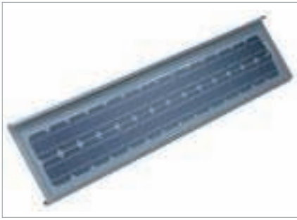
Das QUICK STEP®-Solar PV-Paneel in 2000 mm x 365 mm